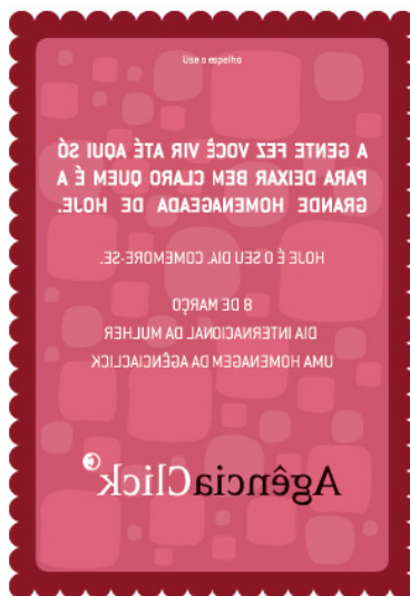
Figura 2 – E-mail marketing: cartão em homenagem ao dia da Mulher

O fullbanner acima foi veiculado em site de conteúdo feminino, para informar ao seu público que a revista TPM, agora estaria disponível no MSN mulher. A arte fez uso de áudio com voz feminina, e muda de cor e forma, de acordo com os movimentos feitos pelo internauta com o uso do mouse. Assim, o banner nos remete a características que fazem menção ao comportamento comum das mulheres quando estão em TPM (tensão pré-menstrual).